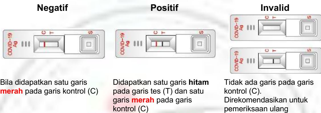
Gambar 4. Interpretasi antigen rapid test