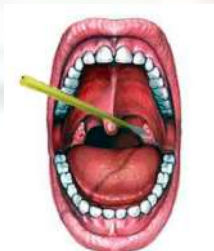
Gambar 2. Lokasi swab orofaring