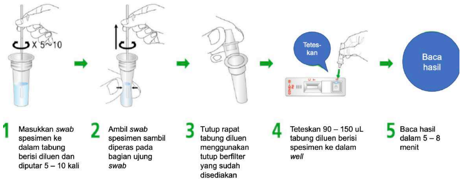
Gambar 3.c. Contoh prosedur pemeriksaan antigen rapid test